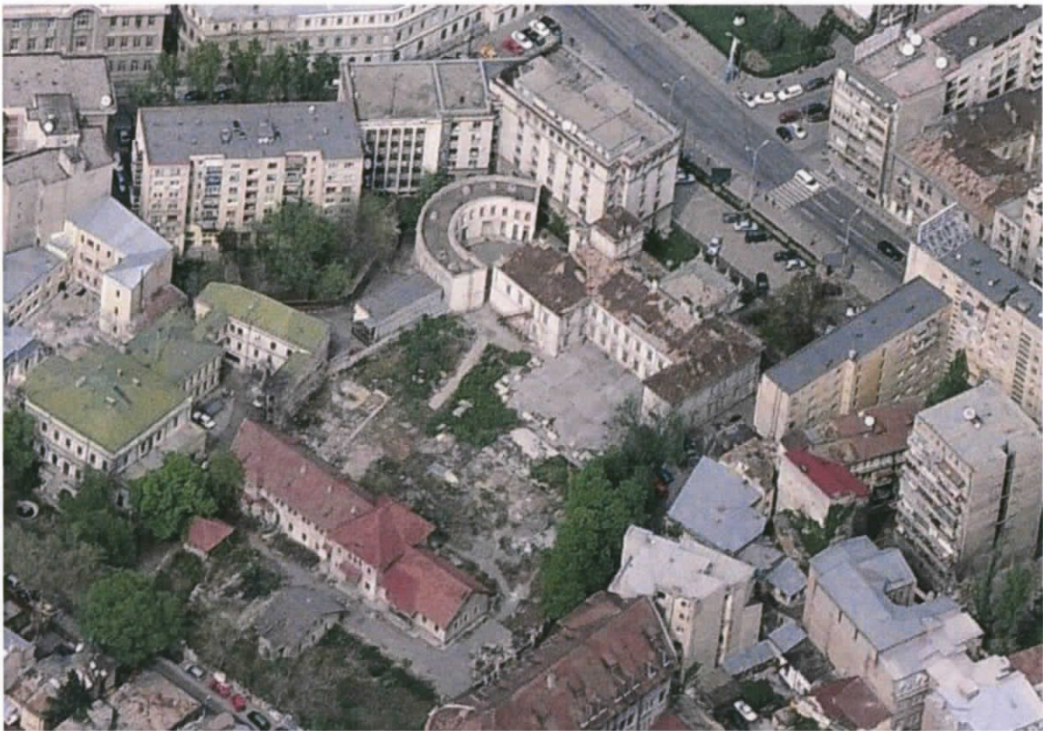
Vedere aeriana amplasament anul 2007