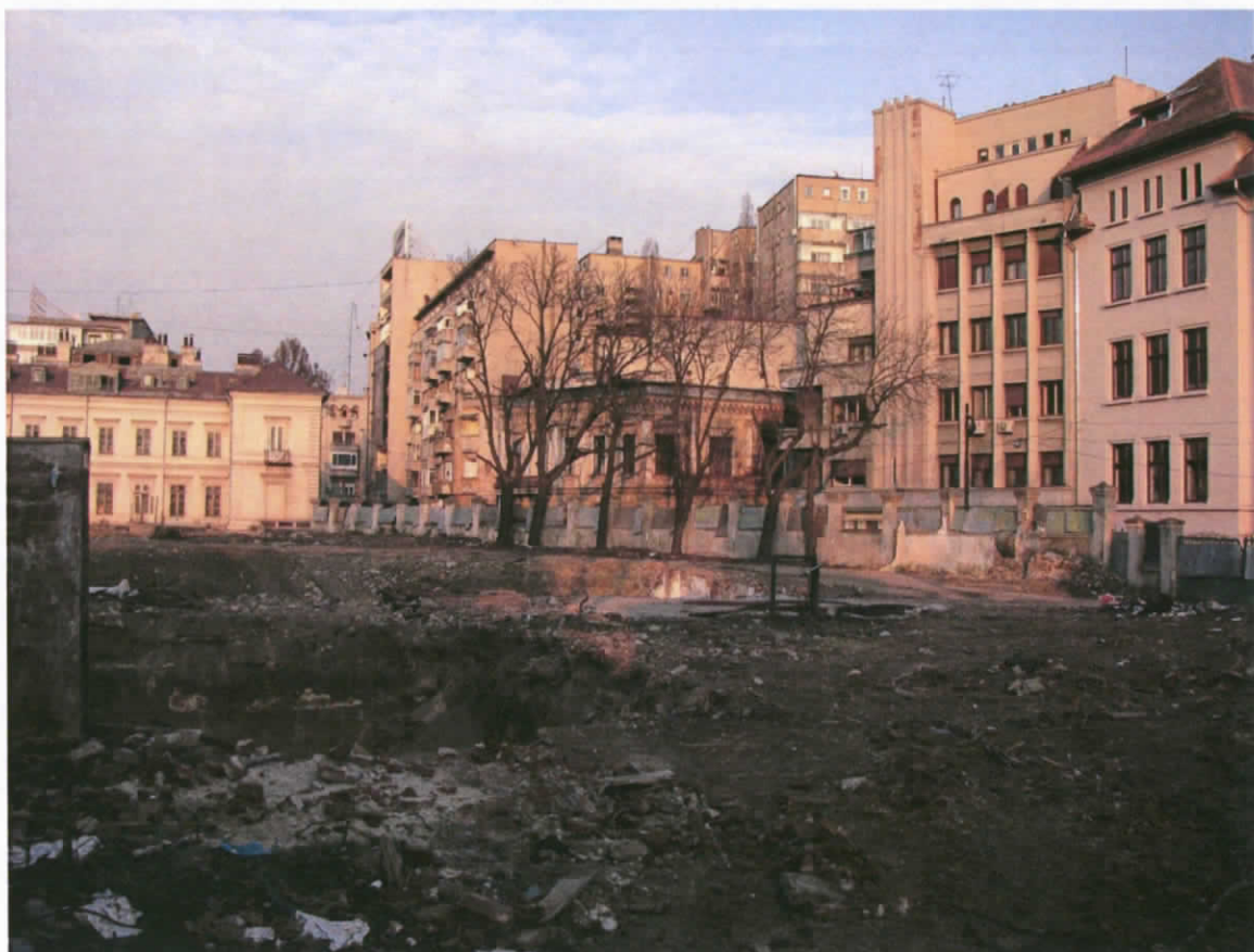
Vedere amplasament anul 2008